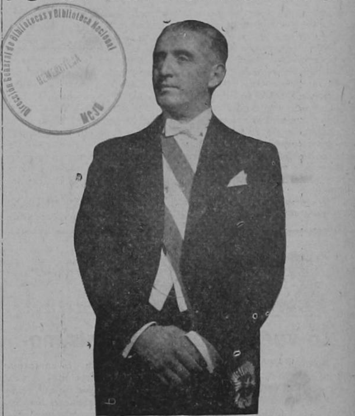
De regreso a su patria, después de haber realizado largo itinerario de solidaridad americana, de haber visitado Estados Unidos y otros países, llegará el domingo a Costa Rica el excelentísimo señor presidente de Chile, don Juan Antonio Ríos. (Pasa a la pág. CUATRO)